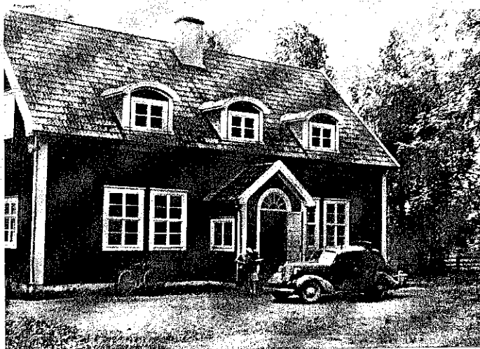
Det nya skolhuset som byggdes 1922.

I slutet av 1850-talet höll man troligen till i ett litet hus nedanför äldre slaggbyggningen med undervisningen, där senare Haléns affär fanns.