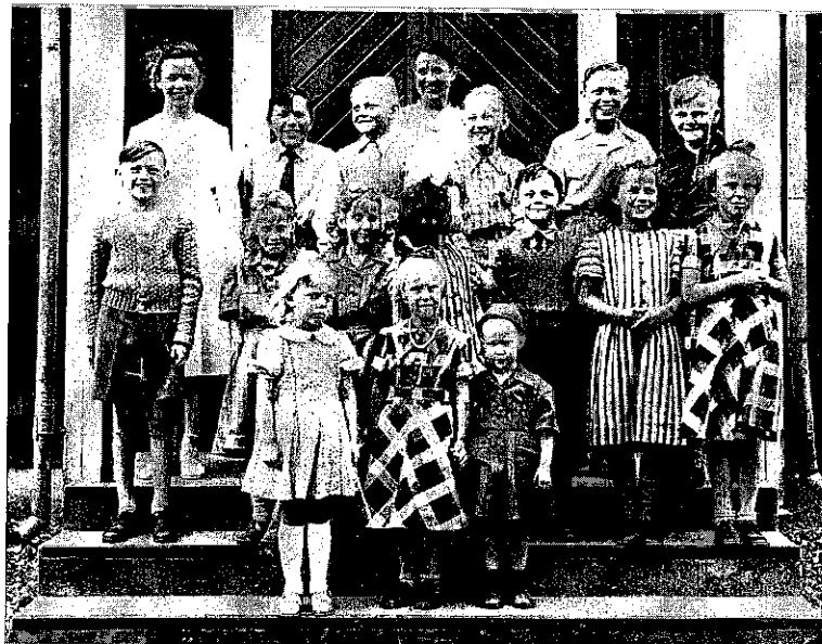
Skolavslutning i Laxsjön 1950.