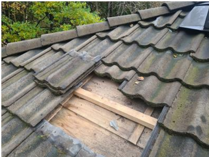
Tak, underlagstak av träfiberskivor.