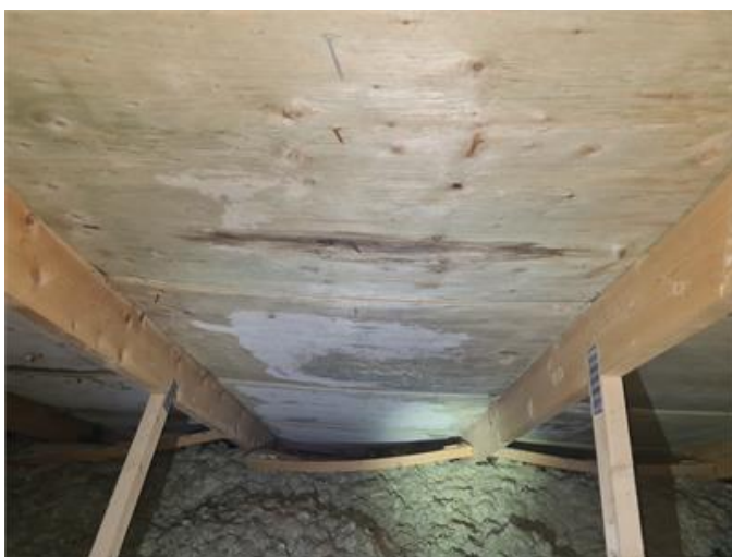
Nockvind, torra läckagefläckar sydost, ljusare områden på undertaksskivorna.