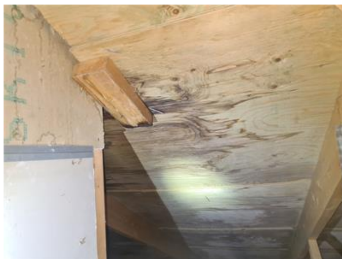
Nockvind, torra läckagefläckar vid östra skorsten, ovanliggande pannor limmade.