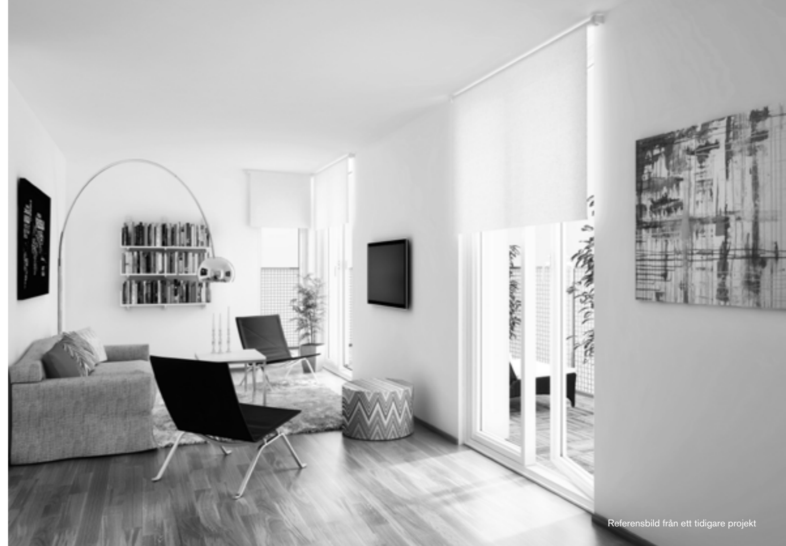
Referensbild från ett tidigare projekt

UTVÄNDIGT: Gård, övriga gårdsytor iordningsställs med gräsmatta, gångytor, blommor, träd, buskar samt terrassering av trall.