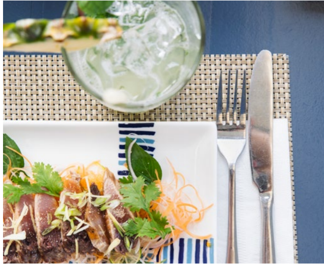
Njut av stadens restaurang- och caféutbud.