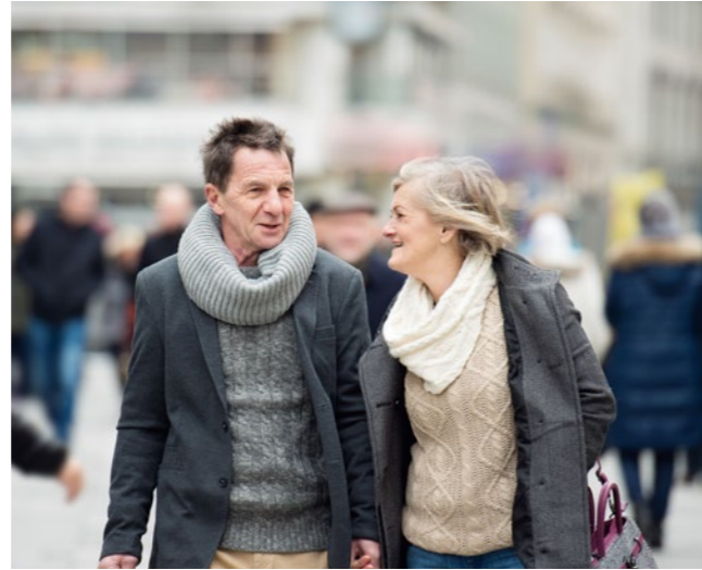
Stora shoppingmöjligheter i en gemytlig atmosfär.