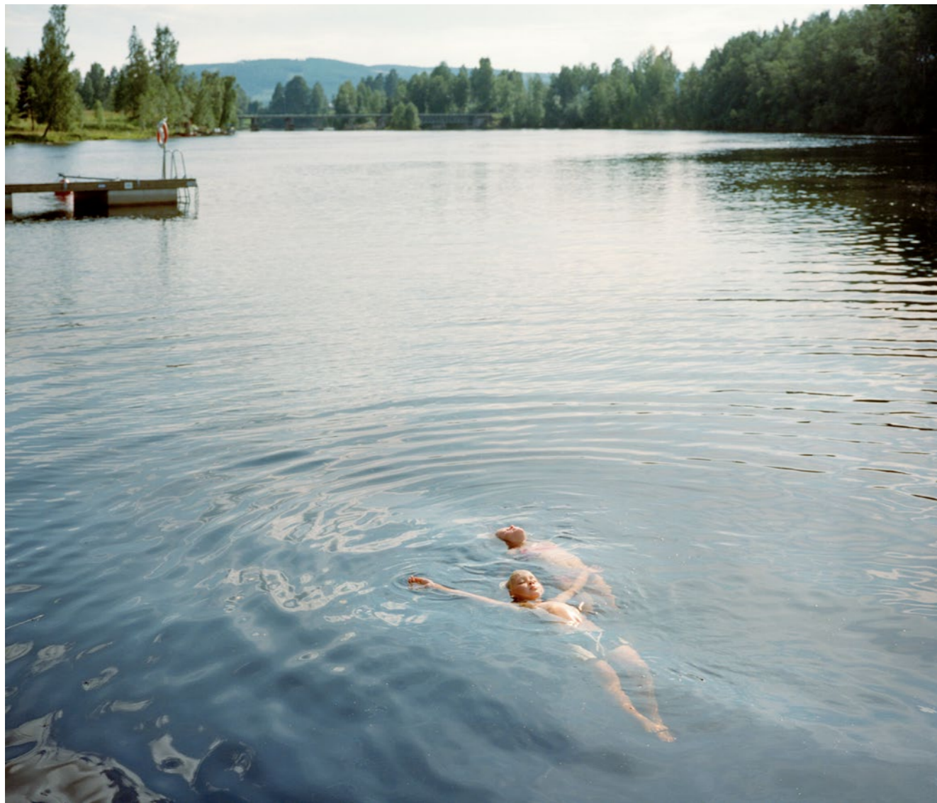
Ta ett uppfriskande dopp i Skellefteälven.