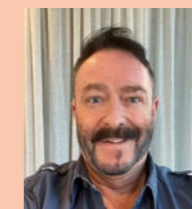
Lars Burlin Arkitekt Arkitektbyrå Design

förvaring och tvättmöjlighet inom lägenheten, tillsammans med öppna planlösningar för socialt umgänge och siktlinjer för att välkomna ljuset och omgivningen. Vi är övertygade om att det kommer att bli en fantastisk boendemiljö nu och långt in i framtiden.