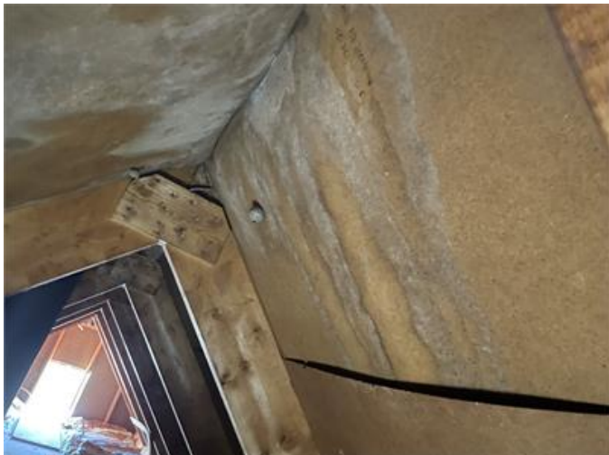
Bilden visar äldre fuktfläckar på vinden.