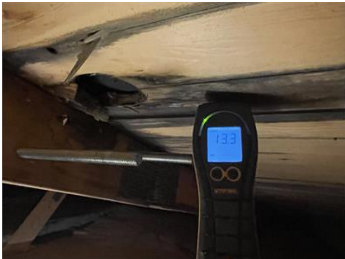
Bilden visar spår av läckage på vinden.