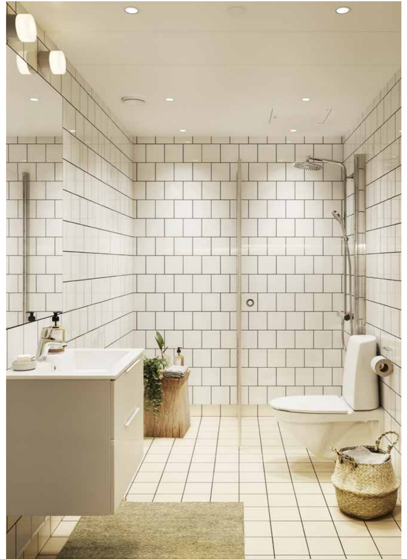
Bilden är en illustration av en badrumstyp. Det är en inspirationsbild och kan visa tillval. Se Bofakta-broschyren för information om materialval och utrustning i badrummet.