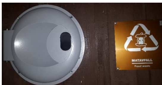
Figur 4 - Lucka för matavfall

Föreningen tillämpar sopsortering och uppmanar alla medlemmar att sortera ut organiskt avfall ur hushållssoporna.