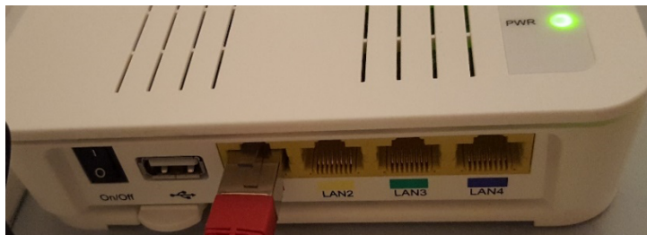
Figur 3 - Anslut nätverkskabeln i "LAN1".

Anslut en nätverkskabel från fibermottagaren LAN1 till din dator och öppna webbläsaren. Ange https://portalen.openuniverse.se i adressfältet och följ instruktionerna på skärmen Beställ ditt bredband från valfri leverantör.