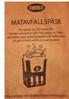
Figur 6 - Papperspåse för matavfall

Avfall som inte faller under kategorin hushållssopor, matavfall eller förpackningar hänvisas till kommunens återvinningscentraler. Läs mer om var de finns på www.avfallskaraborg.se .