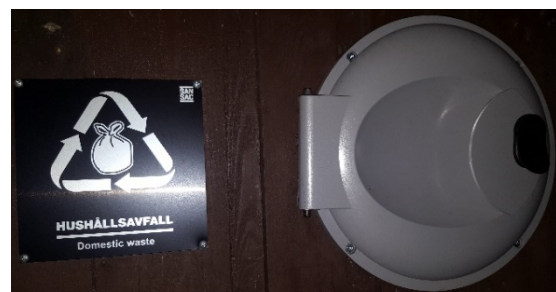
Figur 5 - Lucka för hushållssopor

Sophus finns i anslutning till varje innergård. Det finns 2 luckor, 1 för hushållssopor och 1 för organiskt avfall. Luckorna är låsta och öppnas med lägenhetsnyckeln. I luckan märkt