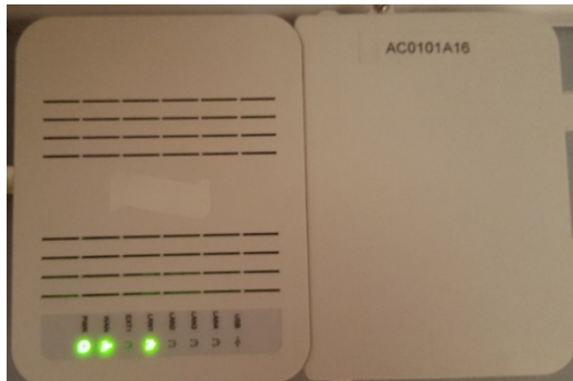
Figur 2 - Fibermottagaren

Bredband levereras via Open Universe till din fibermottagare, som du hittar i hallen ovanför lägenhetsdörren, eller en bit längre in vid golvet.