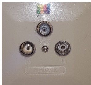
Figur 1 - Tre hål i väggen från COMHEM

Du har fri tillgång till 2 olika tv-abonnemang, vilka båda erbjuder ett grundutbud av kanaler.