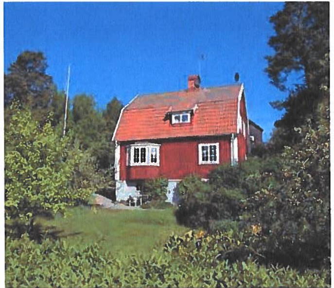
Egnahemsvilla från 1920-talet på Fotbollsvägen i Stuvsta

Inom Stuvstas villasamhälle som började växa fram blev tomterna med gångavstånd till stationen attraktiva för pendlare. Nybyggarna uppförde ofta först en kolonistuga och därefter självbyggda egnahemshus efter typritningar, sin tids kataloghus. Tomterna bebyggdes med egnahemshus under 1920- och 1930-talet. Byggnaderna uppfördes i trä med träpanel och sadeltak eller brutna tak, ofta målade i falurödfärg med vita snickerier. Husen placerades till större delen en bit in på tomten med en stor förgårdsmark som vetter mot gatan där ägarna planterade fruktträd och buskar, land grävdes upp för odling av bland annat potatis och rovor för det egna hushållets behov. Stuvstabolaget lämnade lån i form av byggnadskreditiv och hade från år 1920 egen byggnadsnämnd. Stuvsta municipalsamhälle bildades år 1922 och uppgick i Huddinge stormunicipal år 1947.