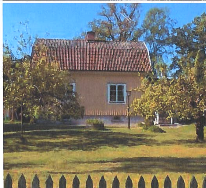
Exempel på tidstypiska villor i Stuvsta/Segersminne från 1920-1940-tal.