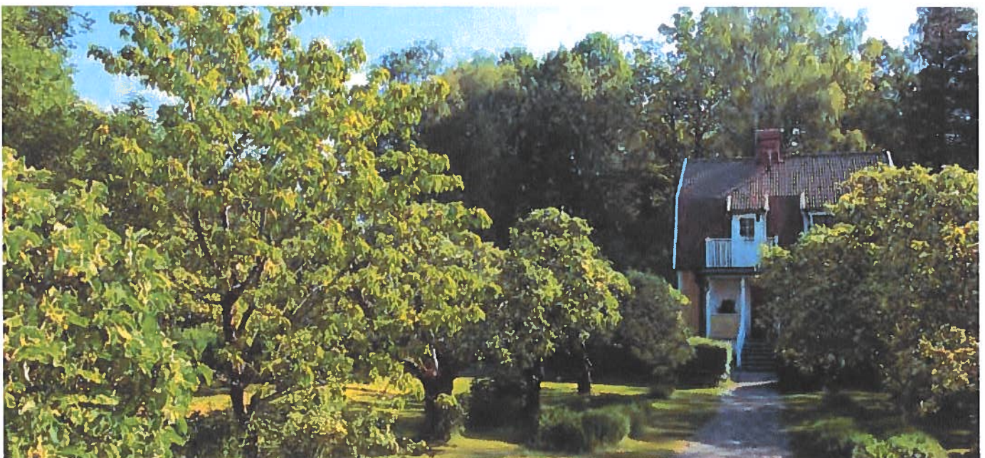
Villa längsmed Dalkarlsvägen 14-18