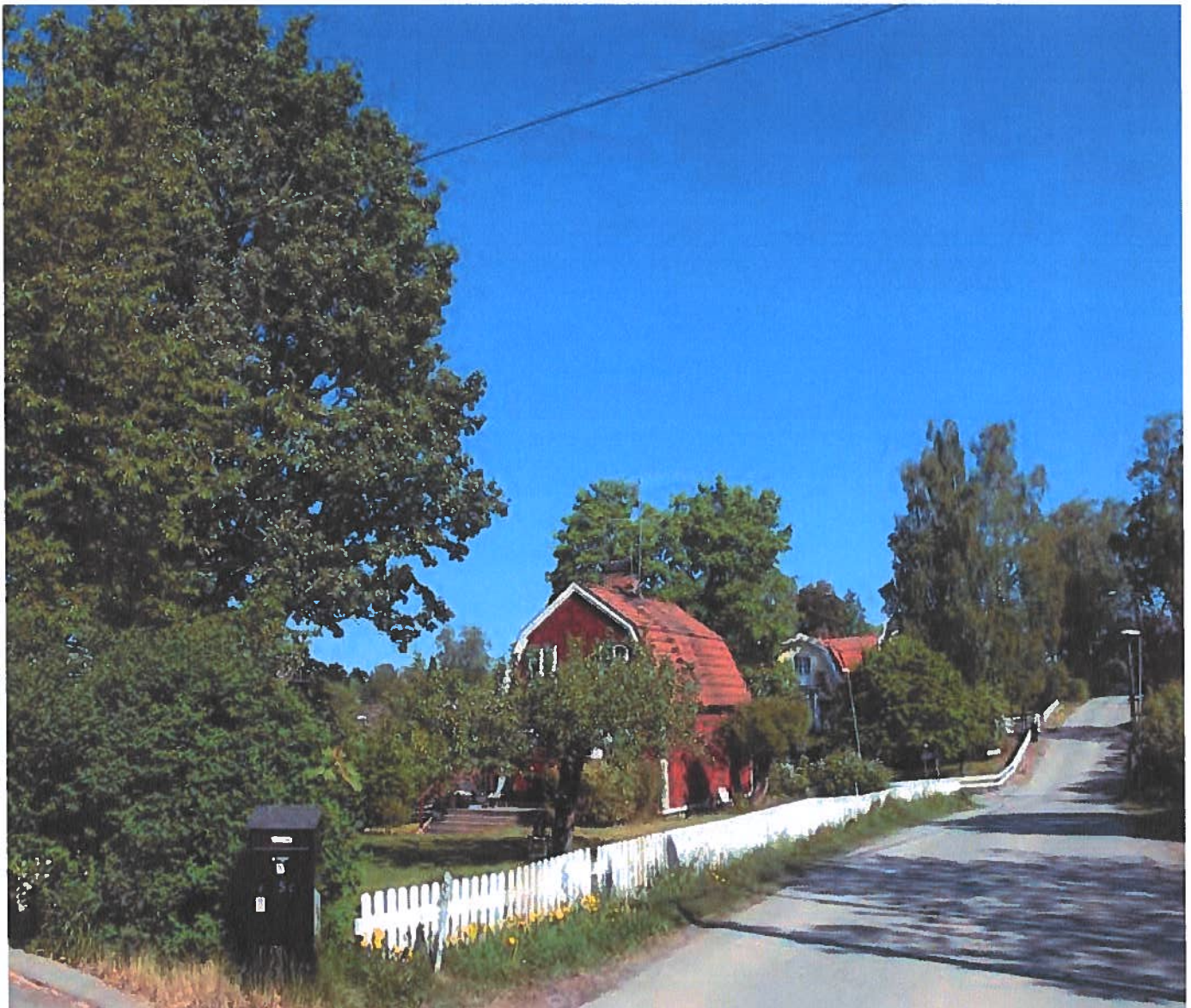
Egnahemshus i Segersminne