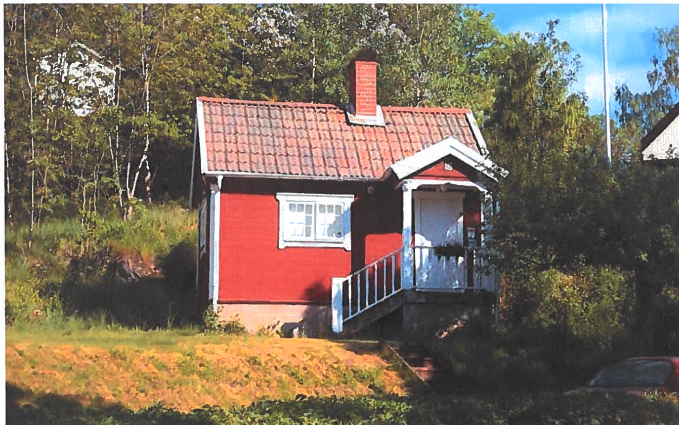
Kolonistuga vid korsningen Dalkarlsvägen/Fotbollsvägen