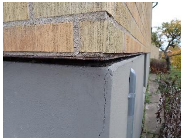
Järnbalk under tegel.

Övriga sprickor förekommer i fasaden. Detta noterat vid entré, vid fönster, altandörr och hörn. Det rekommenderas att dessa sprickor hålls under uppsikt för att på tidigt stadium kunna upptäcka eventuella förändringar.