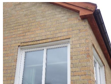
Ovan fönster vid entré.